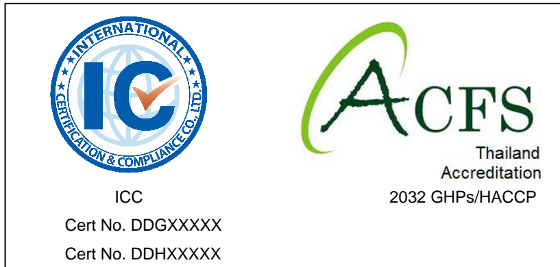
รูปที่ 7 ตัวอย่างการแสดงผลโลโก้ของ ICC ร่วมกับเครื่องหมายรับรองระบบงานของ ACFS (กรณีได้รับการรับรองระบบ GHPs และ HACCP)