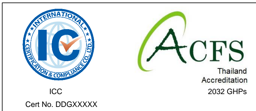
รูปที่ 5 ตัวอย่างการแสดงโลโก้ของ ICC ร่วมกับเครื่องหมายรับรองระบบงานของ ACFS (กรณีได้รับการรับรองระบบ GHPs)